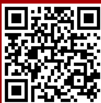
Pencalonan Ketua Jabatan